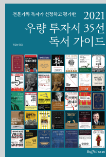
《2021 우량 투자서 35선 독서 가이드》(eBook)