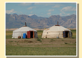
게르 유목 생활을 하는 몽골인들의 집