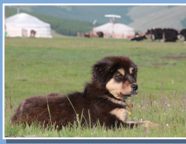
방카르 몽골 유목민들의 수호견