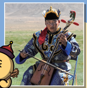
마두금 몽골의 전통 악기