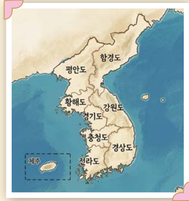
▲ 조선 팔도

혹시 ‘조선 팔도’라는 말을 들어 본 적 있나요? 조선 시대에는 우리나라 땅을 여덟 개의 구역으로 나누어 관리했어요. 우리가 잘 아는 강원도, 경기도, 충청도, 전라도, 경상도와 함께 지금은 북한 땅인 함경도, 황해도, 그리고 평안도가 바로 그 주인공이에요. 평안도는 우리나라 지도의 왼쪽 맨 윗부분에 자리 잡고 있는데, ‘압록강’이라는 큰 강을 사이에 두고 중국과 국경을 맞대고 있답니다.