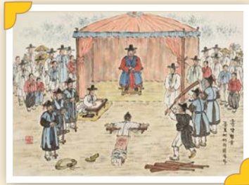
▲ 형벌을 받는 모습을 그린 풍속화 <형정도>

조선 시대에는 죄의 무게에 따라 다섯 가지 벌이 있었어요. 가벼운 죄를 지으면 엉덩이를 때로 맞는 ‘태형’이나 ‘장형’을 받았고, 오늘날의 감옥처럼 가두어 놓고 힘든 일을 시키는 ‘도형’이라는 벌도 있었지요. ‘귀양’으로 잘 알려진 ‘유형’은 먼 곳으로 쫓겨나는 벌이었고, 가장 무거운 벌은 목숨을 빼앗는 ‘사형’이었답니다. <장화홍련전>의 허씨와 장쇠도 결국 벌을 받아 엄한 죄값을 치르게 되고요. 이처럼 조선 시대에는 잘못에 따라 벌을 나누어 사회 질서를 바로잡으려 노력했답니다.