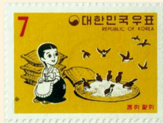
▲ 1969년에 발행된 콩쥐팍쥐 우표

계모가 들어와 주인공을 구박하는 내용의 ‘계모형 가정 소설’은 우리나라뿐만 아니라 전 세계에서 널리 익숙하게 읽혀 왔어요. 우리가 모두 잘 알고 있는 <신데렐라>나 <콩쥐팍쥐>가 대표적이지요.