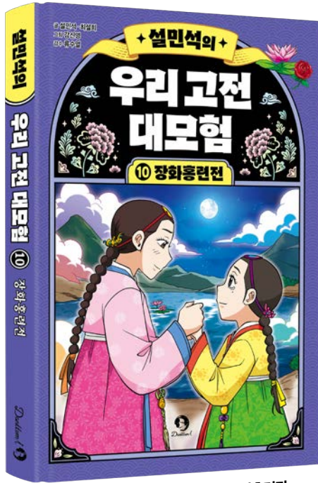
설민석의 우리 고전 대모험 - 10 장화홍련전 글 설민석·최설희 | 그림 강신영 | 감수 류수열