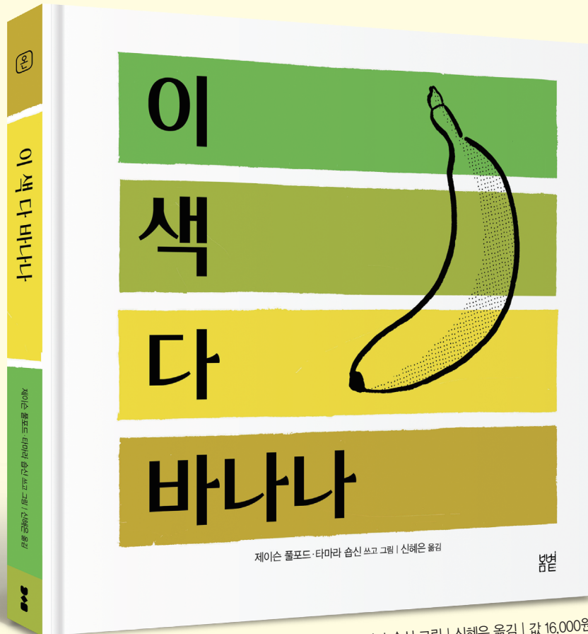
제이슨 폴포드 지음 | 타마라 습신 그림 | 신혜은 옮김 | 값 16,000원

사과가 항상 빨간 건 아냐. 폭풍우 칠 때 구름 본 적 있어? 해 질 녘에는? 구름은 언제나 흰색일까? 개들도 다 색이 달라. 세상 모든 것은 다양한 색을 갖고 있어. 바로 너도, 나도, 우리도.