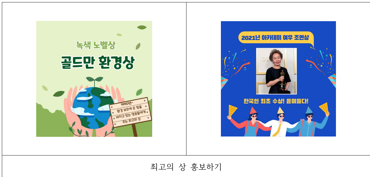
최고의 상 홍보하기