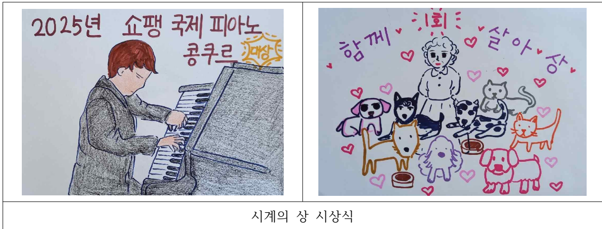
시계의 상 시상식

Tip. 허용적인 분위기 속에서 자기 스스로 주는 상, 친구나 가족 또는 이웃에게 주는 상 등을 자유롭게 상상하도록 한다. 나의 주변에서부터 세상을 아름답게 바꾸는 가치가 실천될 수 있다는 것을 이해하고 가치를 실천하기 위해 꾸준히 노력하려는 마음을 지닐 수 있다.