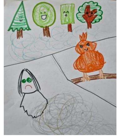
내가 상상한 부엉이 방귀