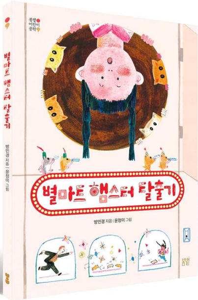
방민경 지음 윤정미 그림 봄별