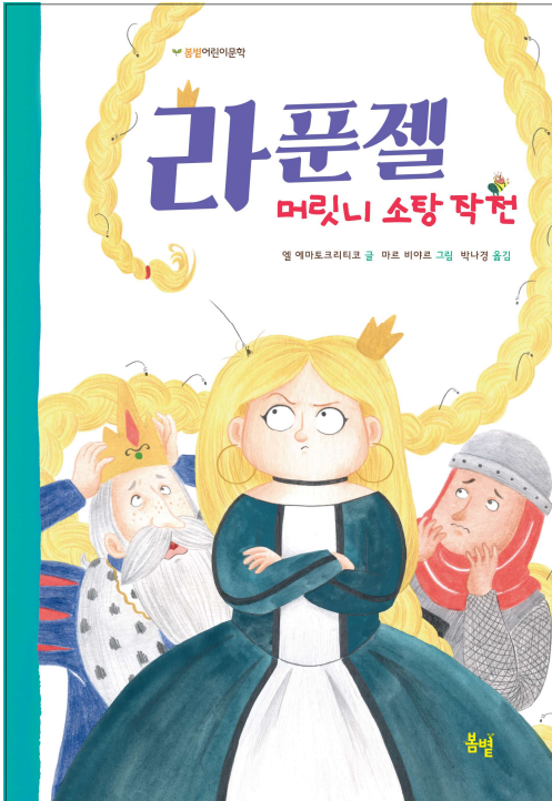
엘 에마토크리티코 글 마르 비야르 그림 박나경 옮김

그림 형제의 동화 모음집에 수록된 작품 <라퐁젤(Rapunzel)>을 바탕으로, 라퐁젤 공주의 가장 중요한 상징인 길고 아름다운 머리카락에 얽힌 소동을 유쾌하게 그려낸 작품이다. 아이와 어른을 불문하고 남들에게 보이기 위한 외모 소비에 치중하는 요즘, 스스로를 둘러싼 가장 큰 편견이자 장애물을 유머와 지혜로 과감히 격파해 나가며 스스로를 진정으로 사랑하기 위한 방법을 모색해 가는 씩씩한 라퐁젤의 이야기.