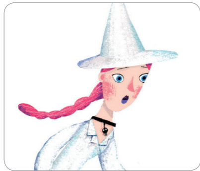
4) 보건 선생님 _____

2. 안아파 선생님은 총 12개의 문제를 냈는데요, 그중 코코가 답을 맞춘 문제는 고작 3개뿐이었습니다. 무슨 문제들이 있었을까요?