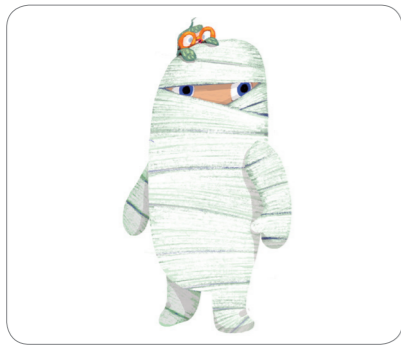
3) 사무장의 조수 _____