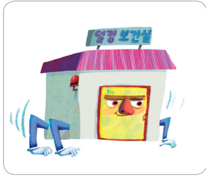
1) 문지기 _____

1. 환자를 찾아 움직이는 '덜컹 보건실'로 실습을 떠난 꼬마 마녀 코코! 코코는 덜컹 보건실에서 누구누구를 만났을까요?