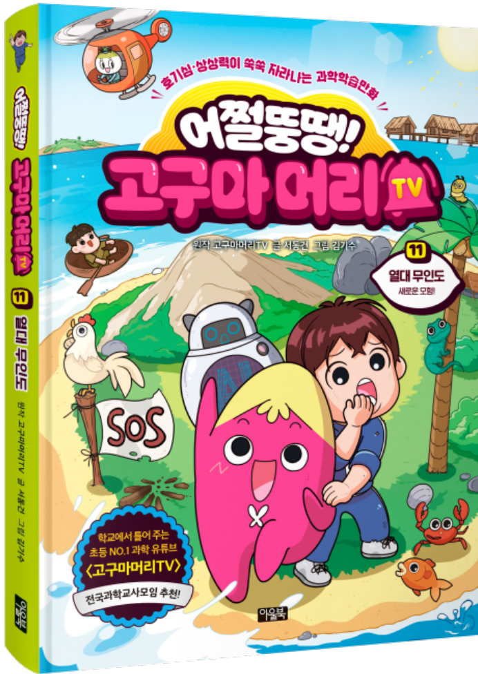
원작 고구마머리TV 글 서동건 그림 김기수