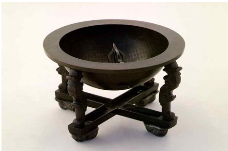
<양부 일구>

'양부일구'와 '자격루'는 조선시대 초기 세종대왕 대에 창제된 해시계와 물시계예요.