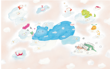
하늘 꿈은 때때와 장난감 친구들을 위해