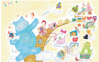
때때와 친구들은 엄마를 위해