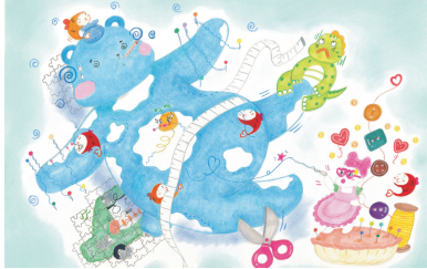
때때와 장난감 친구들은 하늘 꿈을 위해

☁️ 동화 속 친구들은 다른 누군가를 위한 마음을 보입니다. 그림에 알맞은 내용을 찾아 선으로 바르게 이어 보세요.