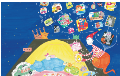
산타 할아버지는 모두를 위해