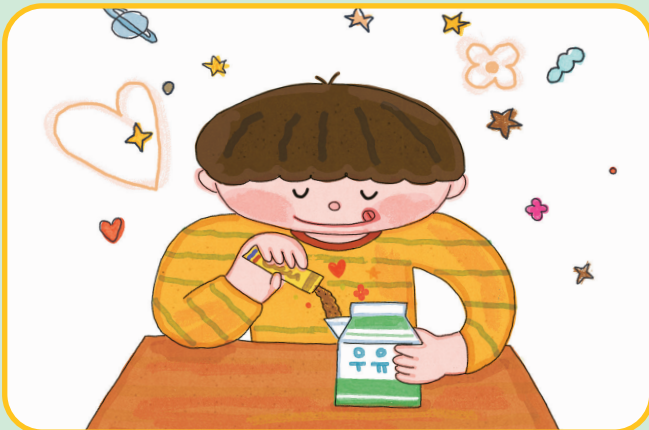
초코우유를 먹었을 때

초코우유를 마셨을 때와 먹지 않았을 때 동훈이의 마음이 어떻게 달라졌는지 이야기해 보세요.