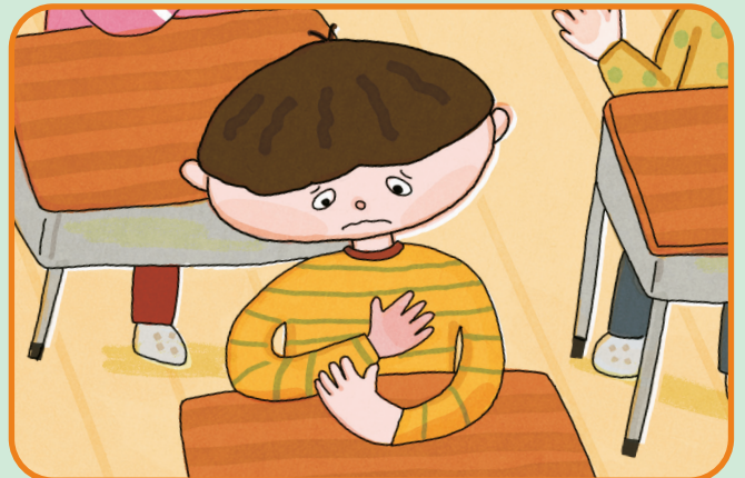
초코우유를 먹지 않았을 때