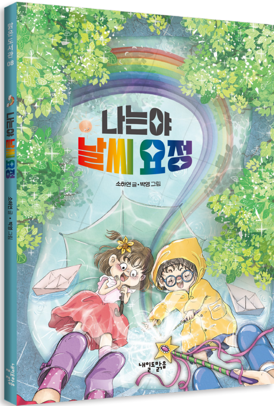
소하연 글, 박영 그림 | 96쪽 | 내일도맑음