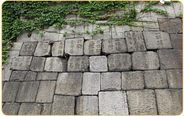
낙산 구간(혜화문~광희문)의 각자성석

한양도성은 당시에 공사를 담당한 사람들의 이름과 직책, 담당 지역 등이 새겨진 돌을 쌓아 만들었는데, 이 돌을 ‘각자성석(刻字城石)’이라고 불러요. 한양도성에는 다양한 시기에 만들어진 각자성석이 280개 이상 전해지고 있어요.