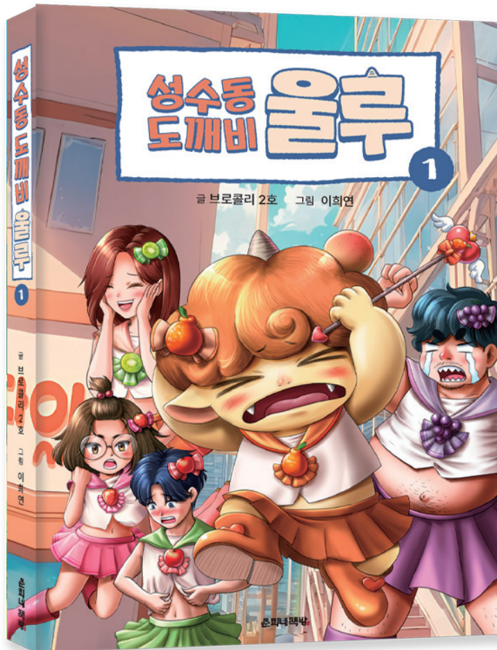
글 브로콜리 2호 | 그림 이희연