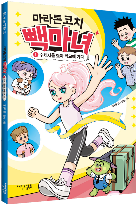
이여주 글, 달상 그림 | 96쪽 | 내일도맑음