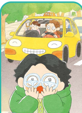
세 번째 손님