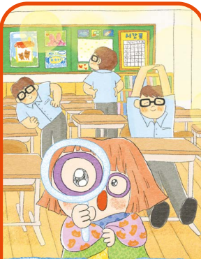
두 번째 손님