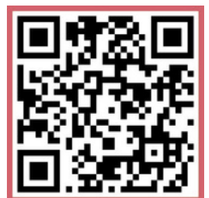
『자유』 본문 가운데 여유당출판사 블로그