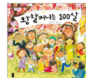
왕할머니는 100살 이규희 글

• 4학년 1학기 국어 교과서 수록도서 • 어린이문화진흥회 좋은 어린이책 • 아침독서신문 추천도서 • 열린어린이 권장도서