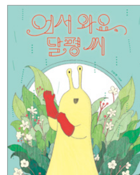
어서 와요, 달팽이 씨

홍익대학교와 같은 학교 대학원에서 회화와 디자인을 공부하고, 한국 일러스트레이션 학교에서 그림책을 공부했습니다. 《또 잘못 뽑은 반장》, 《거꾸로 말대꾸》, 《애들아, 학교 가자!》, 《눈 다래끼 팔아요》, 《가을이네 장 담그기》, 《왕할머니는 100살》을 비롯한 여러 어린이책에 그림을 그렸습니다. 《가을이네 장 담그기》와 《애들아, 학교 가자!》는 교과서에도 실렸지요. 쓰고 그린 책으로 《안녕, 외톨이》, 《언니는 돼지야!》, 《나무가 사라진 날》, 《어서 와요, 달팽이 씨》, 《도망쳐요, 달팽이 씨》, 《또 만나요, 달팽이 씨》, 《급식실의 달팽이 씨》가 있습니다.