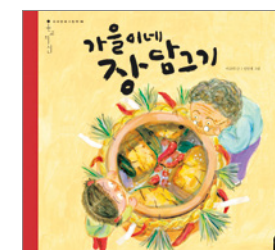
가을이네 장 담그기 이규희 글

• 학교도서관사서협의회 추천도서 • 서울특별시교육청 어린이도서관 사서 추천도서