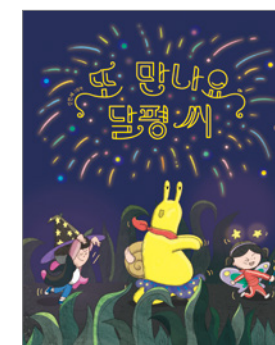
또 만나요, 달팽이 씨