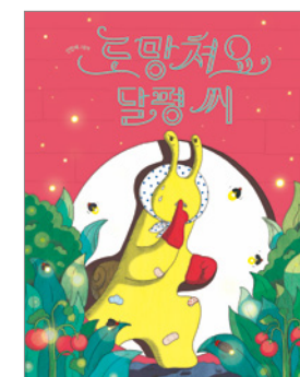
도망쳐요, 달팽이 씨