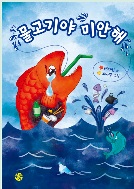
배다인 글 | 도나영 그림 | 값 13,000원

즐거운 추석날 아침, 고은이네 가족이 한자리에 모였어요. 알록달록 예쁜 송편과 고소한 냄새가 풍기는 전을 가득 준비했어요. 다 함께 먹기 위해 커다란 생선 요리도 했고요. 아악! 그런데 이게 무슨 일이죠? 엄마의 비명 소리와 함께 즐거운 추석이 엉망이 되어 버렸어요!