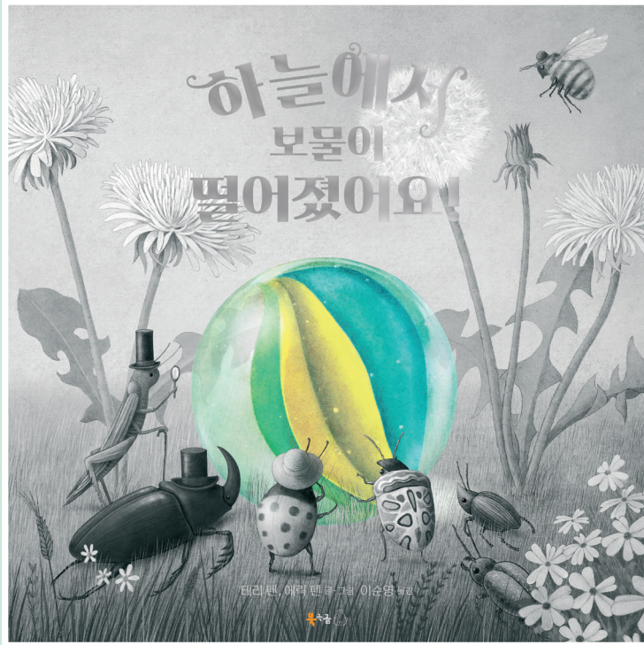
테리 펜, 에릭 펜 글·그림 | 이순영 옮김 | 북극곰