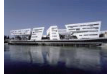
오스트리아 비엔나 슈피텔라우 고가도로 주택 단지