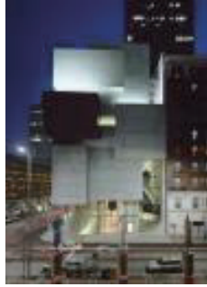
로젠탈 현대 미술 센터 Rosenthal Center for Contemporary Art