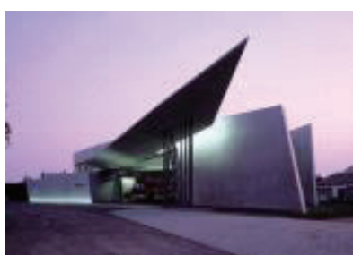
비트라 소방서 Fire Station at Vitra