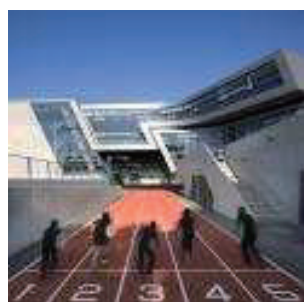
에벌린 그레이스 아카데미 Evelyn Grace Academy