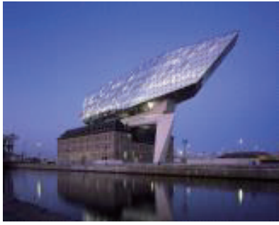
안트워프 포트 하우스 Antwerp Port house