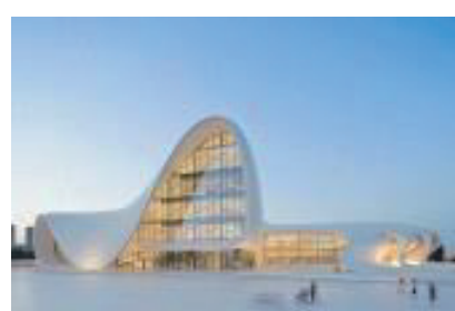
헤이다르 알리에브 센터 Heydar Aliyev Centre