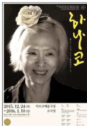
연극 <하나코> 2015년 공연 포스터

6. 평가 : 연극이 끝나고 난 뒤에는 서로의 공연을 평가하고 의견을 나누는 시간을 가집니다.