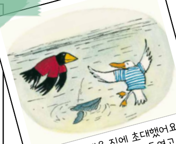
6. 짐은 잭을 집에 초대했어요. 잭은 짐의 초대를 받아들였어요.