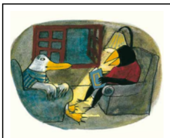
4. 잭은 저녁마다 짐에게 이야기를 읽어 주었어요.