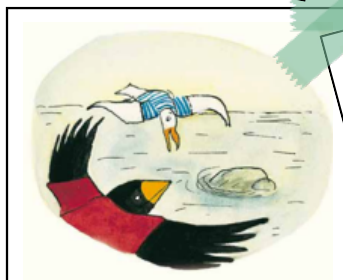
5. 잭과 짐은 오랫동안 함께 낚았어요.