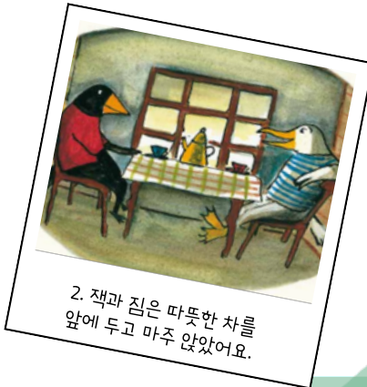
2. 잭과 짐은 따뜻한 차를 앞에 두고 마주 앉았어요.