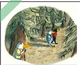
1. 잭은 짐에게 숲에 대해 말해 줄 수 있어 기뻐했어요.

책 속에서 잭과 짐이 우정을 나누는 여러 장면 중 여러분이 좋아하는 장면을 골라보고, 그 장면에서는 우정의 세 가지 마음 중 어떤 마음이 담겨있는지 생각해 봅시다. (한 장면에 여러 가지가 담겨 있을 수 있어요. 정답은 없어요!)