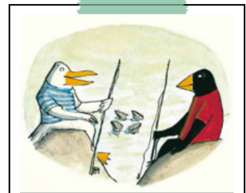
3. "그렇지 않으면 내가 너희 집으로 가면 돼."