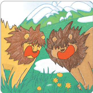
앞이 잘 안 보이는 사자들