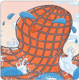
그물에 걸린 대왕 문어