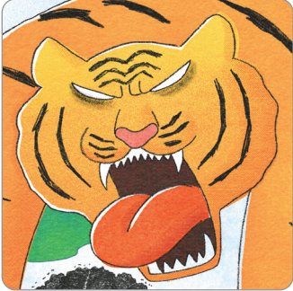
일 년 동안 똥을 못 눈 호랑이

복주머니 요정이 누군가를 도울 때마다 복주머니에 소중한 복들이 쌓여요. 복주머니 요정이 남을 어떻게 돕고, 그 뒤 복주머니 요정은 어떤 복을 받았는지 글로 표현해 보세요.