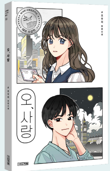
사계절 1318문고 126 조우리 장편소설

※ 이 지도안은 사계절출판사 홈페이지( www.sakyejul.net ) > 한 학기 한 권 읽기 > 독서 지도안(중고등)에서 내려받을 수 있습니다.