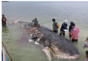
플라스틱 오염: 죽은 고래 뱃속에 플라스틱 컵 115개 들어있어 (BBC뉴스 코리아 2018년 11월 21일)

뱃속 플라스틱 쓰레기 '가득'... 폐사해 돌아온 바다거북 / SBS https://www.youtube.com/watch?v=8En5Q6_LtyM