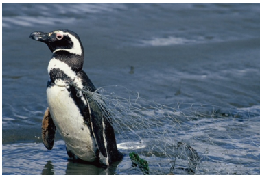
철레 철로에 섬에서 어망에 걸린 마젤란 펭귄