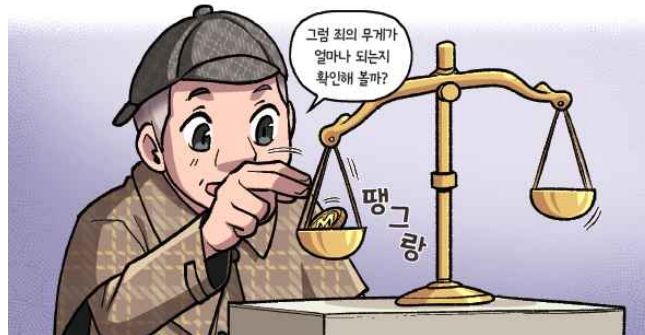
제시어 : 정의의 여신, 그림, 탁자, 저울, M 코인

2) 비밀의 공간을 열기 위해서는 퍼즐을 풀어야 했어요. 주어진 제시어들을 사용해 퍼즐을 푸는 방법을 설명해 봅시다.