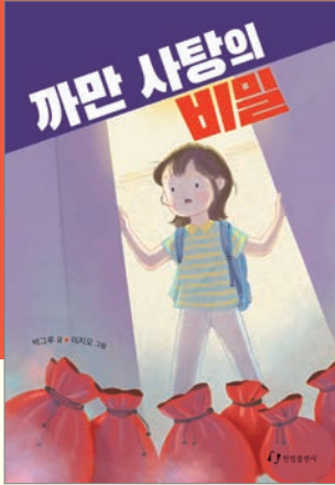
박그루 글 · 이지오 그림 | 120쪽