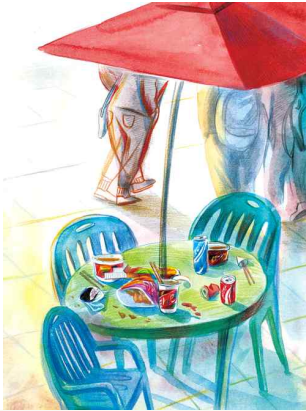
# 대학생 형들이 있던 곳

여름에 창문을 열어 놓으면 밤새 남자들 수대에 잠을 설치기 [ ] . 우리 집만 봐도 아빠가 엄마보다 [ ] 가 더 많다. 잠깐 [ ] 을 하고 있는데 대학생 형이 컵라면에 [ ] 를 집어넣는다. 침도 [ ] . 녀석도 봤겠지 하는데 [ ] 에 정신이 팔려 있다. 곧 녀석은 기다린 [ ] 이 있다는 듯 컵라면을 먹을 것이다! 이 순간에 내가 할 수 있는 [ ] 한 가지다. [ ] 하다가는 늦어 버린다. (21-22쪽)