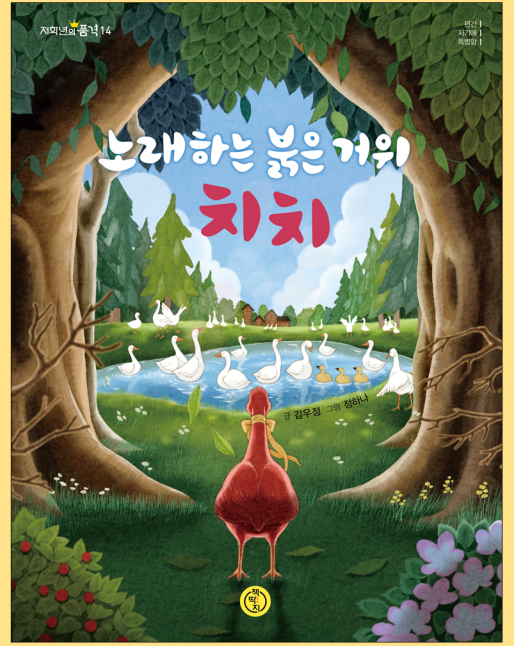
김우정 글 | 정하나 그림 | 책따지 펴냄