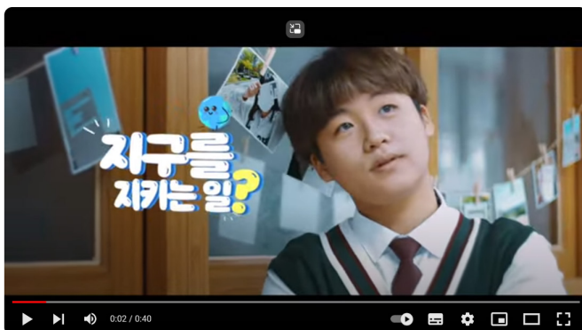
지속 가능한 미래를 위한 환경교육 | 충북교육시책 캠페인