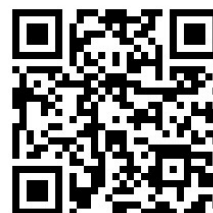
영상 링크 QR코드