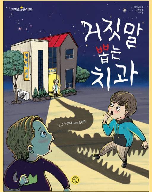
고수산나 글 | 홍찬주 그림 | 책따지 펴냄