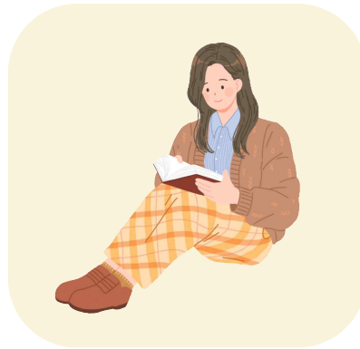
<내면적 아름다움의 예시>