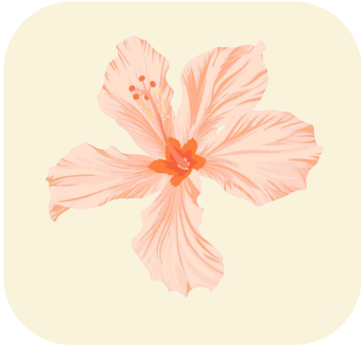
<외면적 아름다움의 예시>