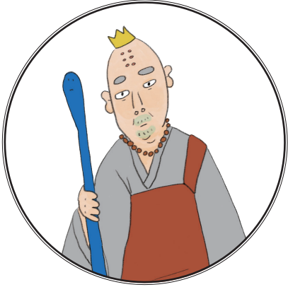
① 어느 날 갑자기 손사공을 찾아온 이장법사

• 다음 중 손사공의 경전을 훔치려는 범인은 누구일까요? 범인을 찾아보세요! 한 명이 아닐 수도 있습니다.