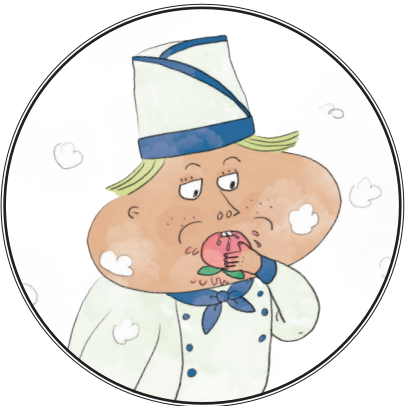
③ 수타 자장면을 만드는 요리사 지팔계