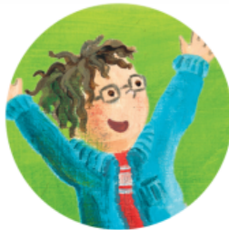
나는 나를 사랑해. 다른 사람도 날 사랑해!