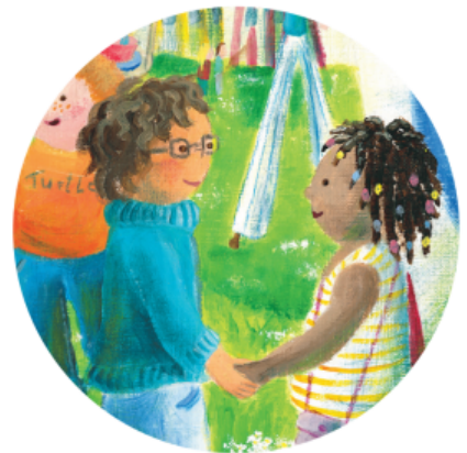
"안녕, 친구가 되어 줄래?"