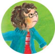
아무도 날 좋아하지 않아