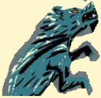
모도리, 슈롭과 회색 늑대 무리

달별은 강물 위의 별이 되었지만, 그 이름은 아주 오래도록 빛날 거예요. 달별이 떠난 이후 다른 등장인물들은 어떻게 되었을까요?