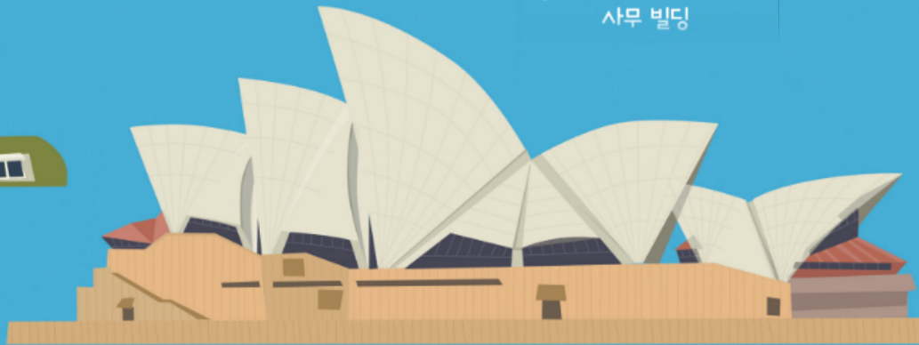
예른 웃손 오스트레일리아 시드니 1959~73년 오페라 극장