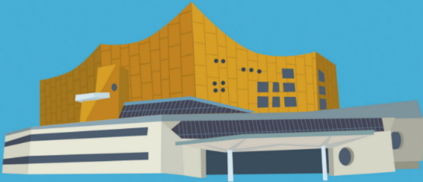
한스 샤로운 독일 베를린 1960~63년 연주회장

1. 다음은 시대 정신을 상징하는 세계의 대표적인 건물들입니다. 각 건물의 그림과 설명을 보고 건물의 이름을 찾아 써 봅시다.