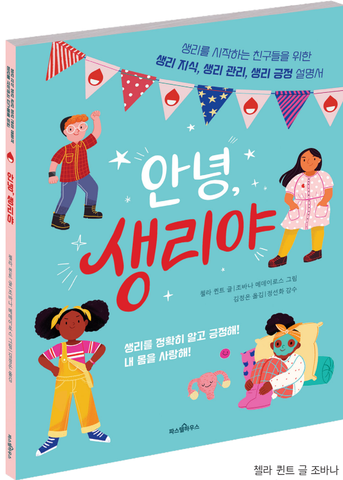
첼라 킨트 글 조바나 메데이로스 그림 김정은 옮김 정선화 감수