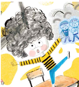
뽕글이 파마머리를 한 남자애 빵야, 빵야. 김 일병, 폭탄 투하!