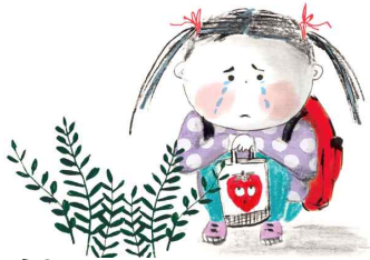
지유 학교가 무섭다고요? 에이, 선생님은 어른이잖아요.