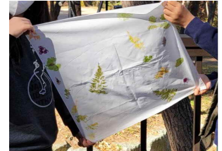
떨어진 나뭇가지, 나뭇잎, 낙엽, 꽃으로 작품 만들기 떨어진 나뭇잎에 편지 쓰기