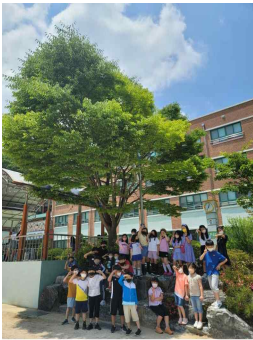
우리 반 나무와 사진찍기

- 우리 반 모두가 나무정령이 되어 사랑하는 마음으로 지켜주고 나무를 가꾸어 봅시다.