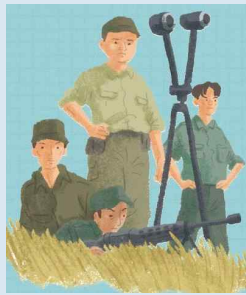
독도 의용 수비대