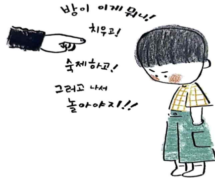
엄마가 큰 소리로 야단치면 나도 큰 소리로 말대꾸를 하고 싶어져.