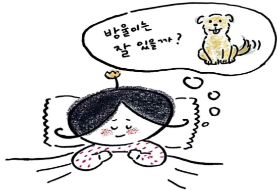
잠자려고 눈을 감고 누워도 얼굴이 아른아른 떠올라.