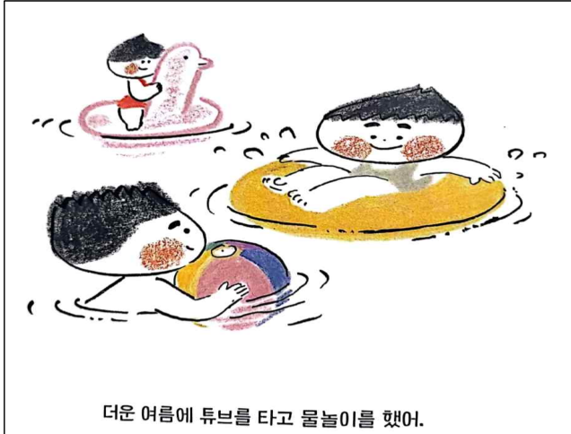
더운 여름에 튜브를 타고 물놀이를 했어.