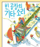
빈 공장의 기타 소리 전진경 지음