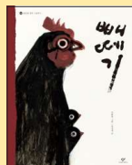
배데기 권정생 글 | 김환영 그림