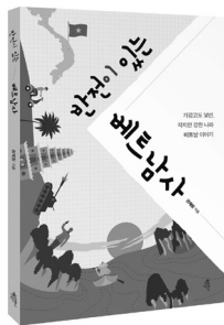
반전이 있는 베트남사 가깝고도 낯선, 작지만 강한 나라 베트남 이야기 권재원 지음 | 168쪽 | 13,000원