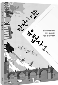
반전이 있는 유럽사1 편견의 장벽을 허무는 독일·오스트리아·체코·헝가리 이야기 권재원 지음 | 236쪽 | 14,000원