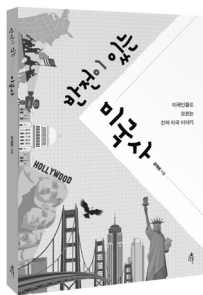
반전이 있는 미국사 미국인들도 모르는 진짜 미국 이야기 권재원 지음 | 248쪽 | 14,500원