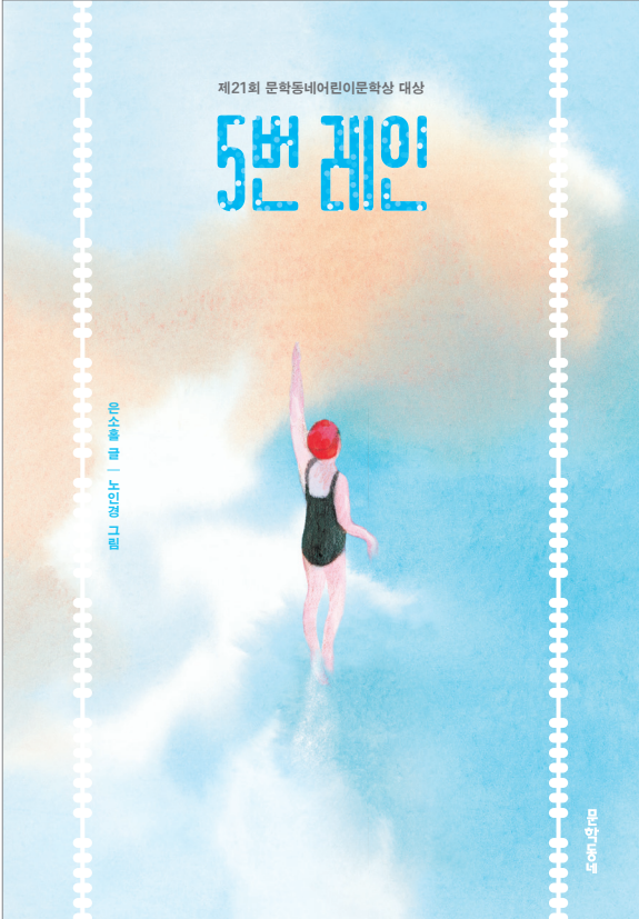
[책 표지 1]

두 종류의 『5번 레인』 표지를 보고, 책에 대해 짐작할 수 있는 것을 써 보세요.