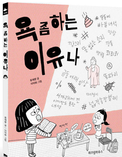
류재향 글 | 이덕화 그림 | 위즈덤하우스