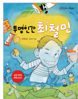
투명인간 최철민 한예찬 글 | 공공이 그림