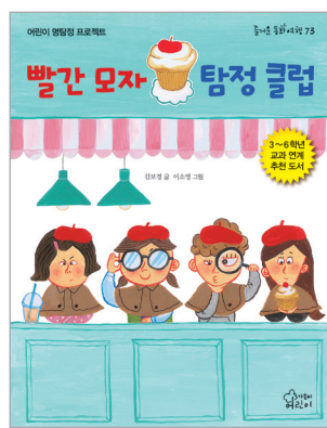
빨간 모자 탐정 클럽 김현정 글 | 이소영 그림