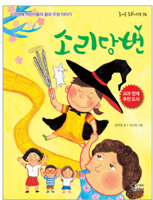
소리당번 김학철 글 | 이소영 그림