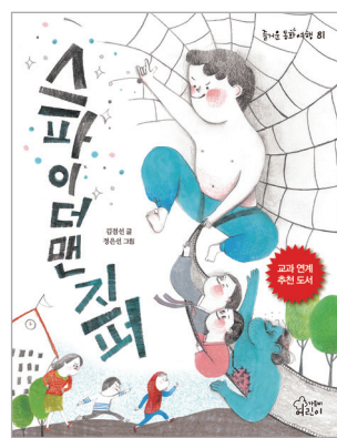
스파이더맨 지퍼 김점선 글 | 정은선 그림